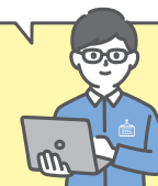
日新運輸保税物流 通関件数